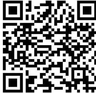
เอกสารการประชุม คปสจ. ๓ /๒๕๖๖