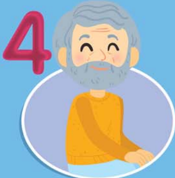
4 ผู้สูงอายุ ตั้งแต่ 65 ปีขึ้นไป