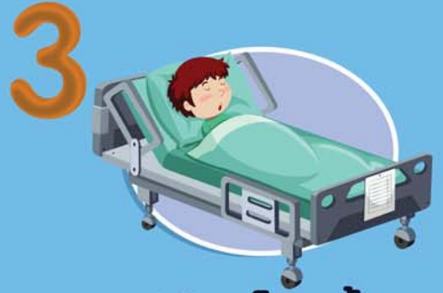
3 ผู้ป่วยโรคเรื้อรัง ปอดอุดกั้นเรื้อรัง หอบหืด หัวใจ หลอดเลือดสมอง ไตวาย ผู้ป่วยมะเร็งที่อยู่ระหว่างการได้รับเคมีบำบัด และเบาหวาน