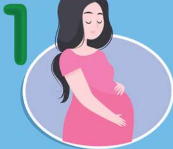
1 หญิงตั้งครรภ์ อายุครรภ์ 4 เดือนขึ้นไป

ป้องกันและลดอาการเจ็บป่วยรุนแรงจากภาวะแทรกซ้อน