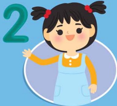
2 เด็กเล็ก อายุ 6 เดือน - 2 ปี