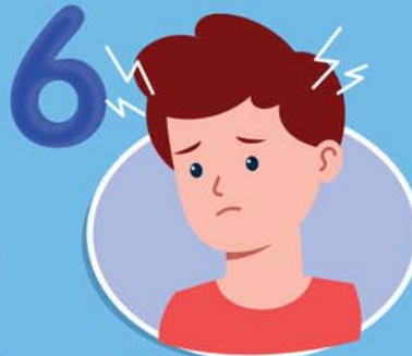
6 ผู้พิการทางสมอง ที่ช่วยเหลือตัวเองไม่ได้