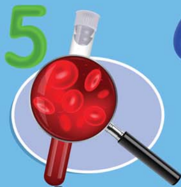
5 ผู้ป่วยโรคโลหิตจาง และผู้ที่ภูมิคุ้มกันบกพร่อง (รวมถึงผู้ติดเชื้อ HIV ที่มีอาการ)