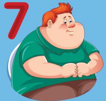
7 โรคอ้วน น้ำหนักมากกว่า 100 กก. หรือ BMI มากกว่า 35 กก./ตร.ม.

รับวัคซีนไขหวัดใหญ่ ไม่ต้องเสียค่าใช้จ่าย ได้ที่ สถานบริการสาธารณสุขของรัฐใกล้บ้าน